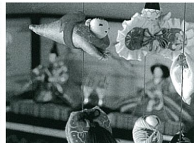
雛のつるし飾り(イメージ)