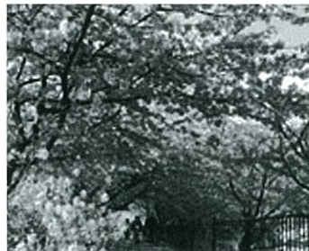
河津駅から河口まで続く河津桜並木